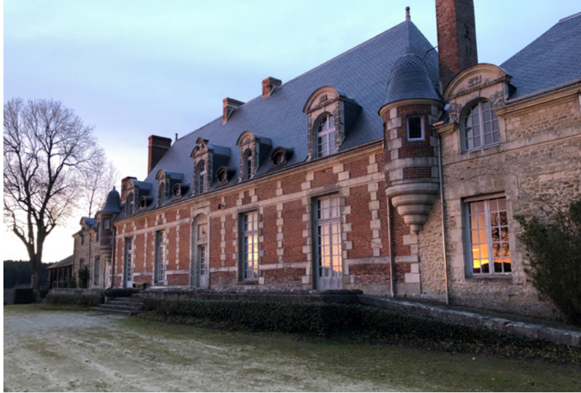
Château du Tertre

La pièce est précédée d'une lecture d'extraits du Journal et de correspondances de Roger Martin du Gard (durée 10 mn). Cette présentation éclaire le public sur le contexte d'écriture de la farce.