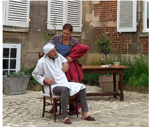
La grande histoire