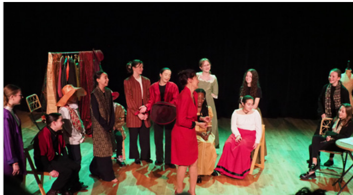
Spectacle le Misanthrope à tout prix par la Compagnie du Plateau libre avec les élèves du conservatoire de Breuillet - novembre 2025.

COMPAGNIE DU PLATEAU LIBRE : 1291 Route du Châble, 61250 Heloup compagnieduplateaulibre@gmail.com